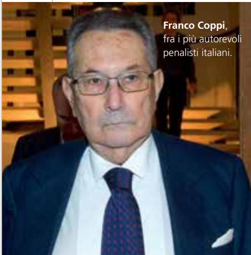
Franco Coppi , fra i più autorevoli penalisti italiani.